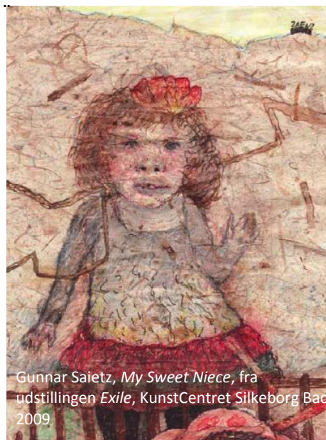
Gunnar Siefert, My Sweet Niece , fra udstillingen Exile , KunstCentret Silkeborg Bad 2009