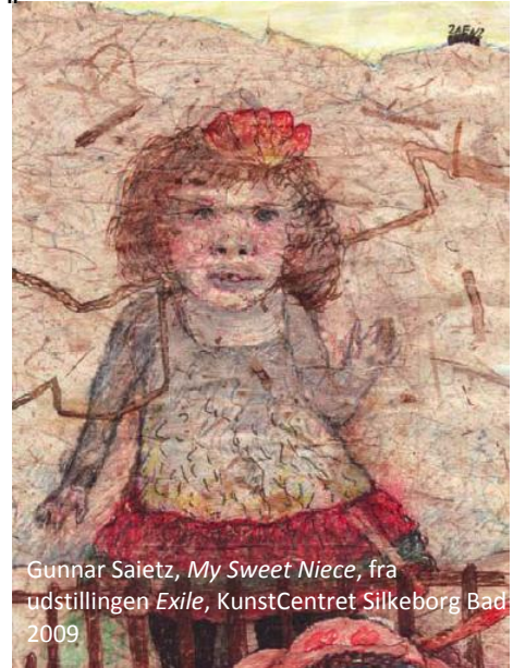
Gunnar Sætz, My Sweet Niece , fra udstillingen Exile , KunstCentret Silkeborg Bad 2009