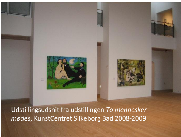
Udstillingsudsnit fra udstillingen To mennesker mødes , KunstCentret Silkeborg Bad 2008-2009