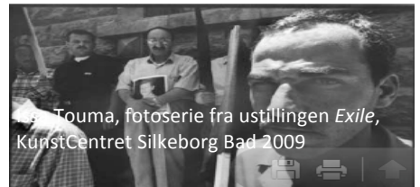
Touma, fotoserie fra udstillingen Exile , KunstCentret Silkeborg Bad 2009