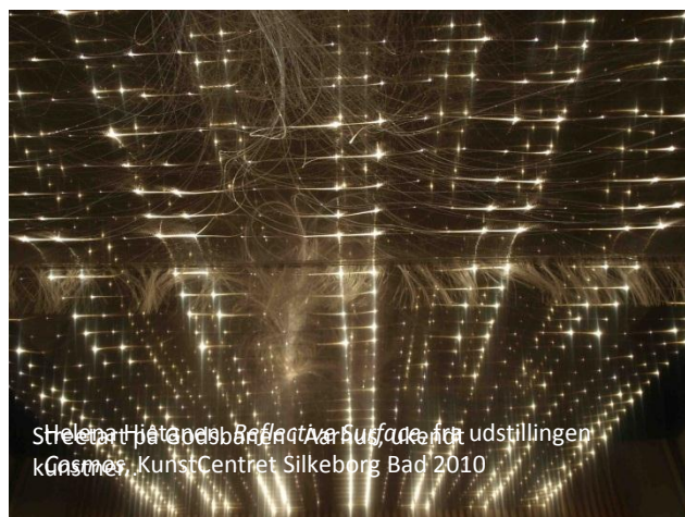
Helena Pietroneri, Reflective Surface , fra udstillingen Gasmer , KunstCentret Silkeborg Bad 2010