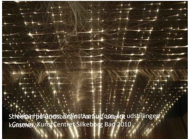
Helena Hietanen, Reflective Surface , fra udstillingen Gasme , KunstCentret Silkeborg Bad 2010