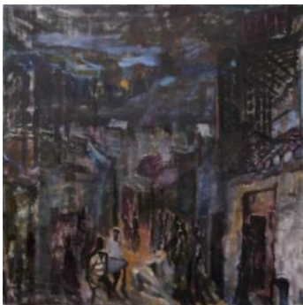
Morten Skovmand: Aften i Beijing, 2011