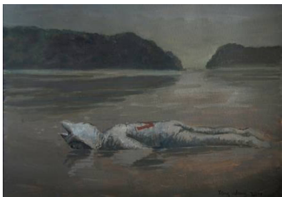
Tong Wang: Motiv fra Ørnsø, 2011