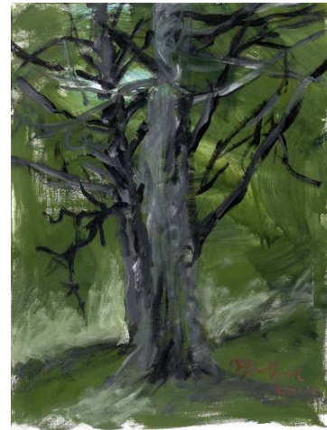
Billeder, malet af tre forskellige kinesiske kunstnere på besøg i Silkeborg, 2011.