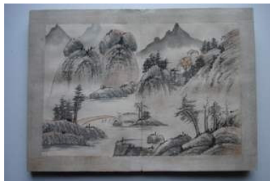
Traditionelt kinesisk udtryk