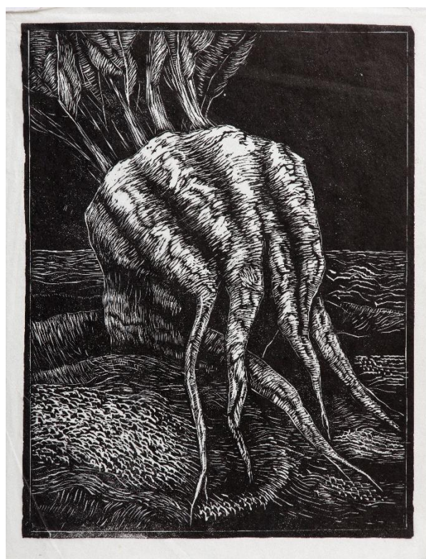
Ingemann Andersen: Vinstave . 2009. Træsnit (tv) , og Sukkerroe . 2001. Træsnit (th) .