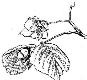
C.V. Stubbe-Teglbjerg: Hasselkvist, 1946. Pen.